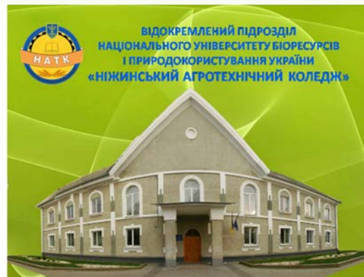
Відеоматеріал про Ніжинський агротехнічний коледж НУБіП України.